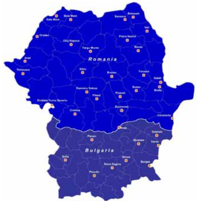
Scoring der regionalen Einzelhandelsmärkte in Bulgarien und Rumänien im Rahmen einer Gemeinschaftsuntersuchung zum Einzelhandel in beiden Ländern.