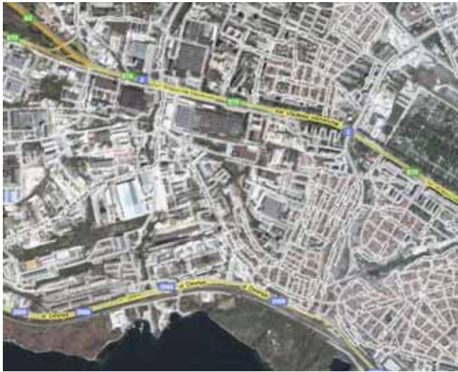
Festlegung von Marktwertbestimmungen für ein Osteuropa-Portfolio eines deutschen Investors, mit den Marktnutzungen Büro und Logistik.